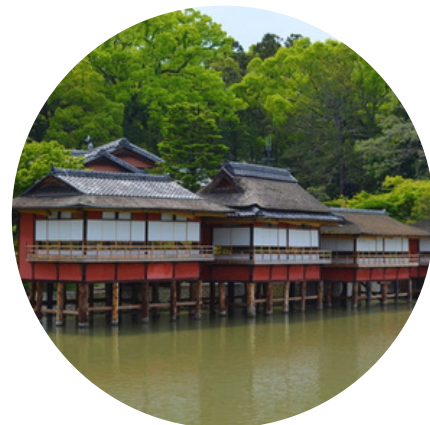
錦水亭 (筍弁当、4800円) 京都府長岡京市天神2-15-15